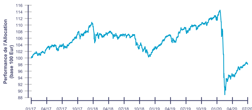
Les performances passées ne reflètent pas les performances futures.