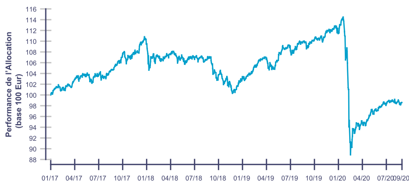
Les performances passées ne reflètent pas les performances futures.