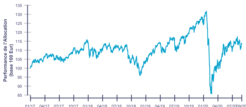
Les performances passées ne reflètent pas les performances futures.