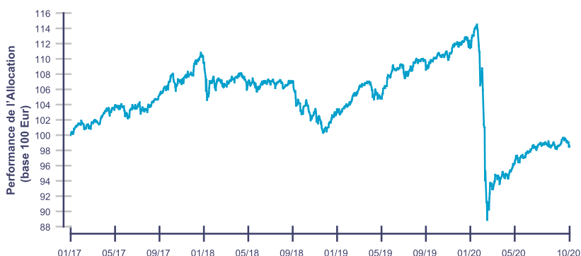
Les performances passées ne reflètent pas les performances futures.