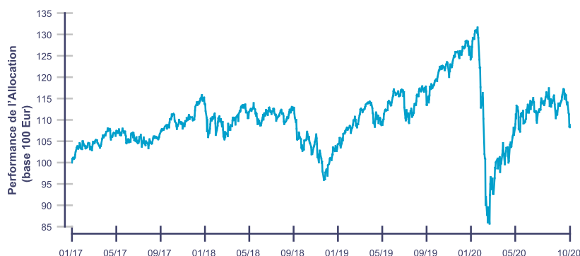
Les performances passées ne reflètent pas les performances futures.