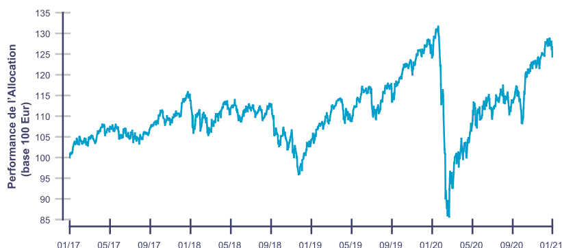
Les performances passées ne reflètent pas les performances futures.