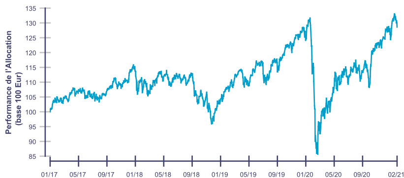
Les performances passées ne reflètent pas les performances futures.