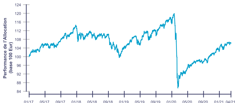
Les performances passées ne reflètent pas les performances futures.