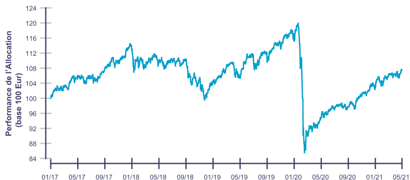
Les performances passées ne reflètent pas les performances futures.